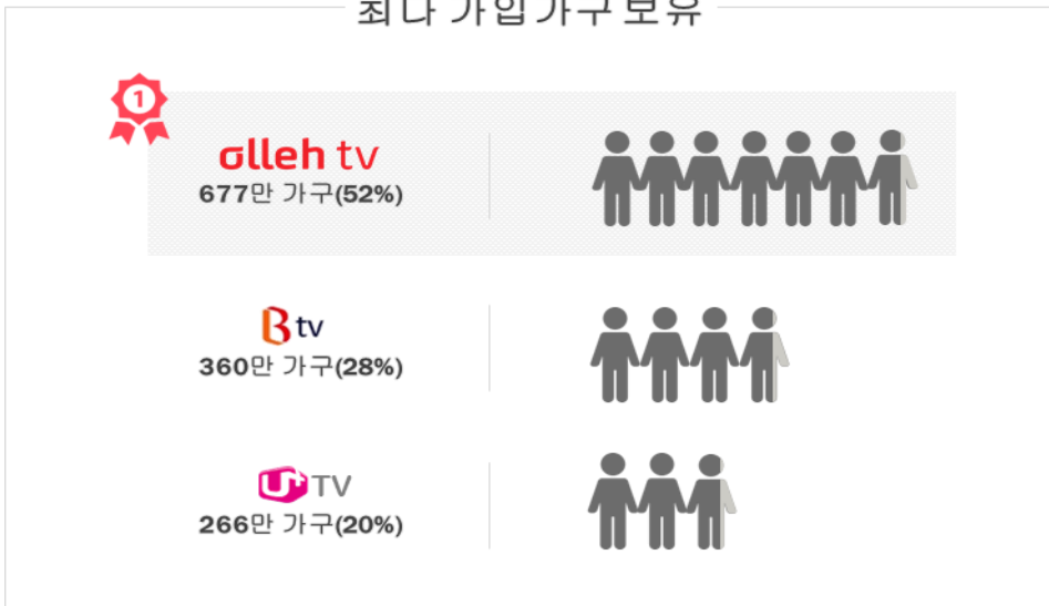
최다 가입가구 보유